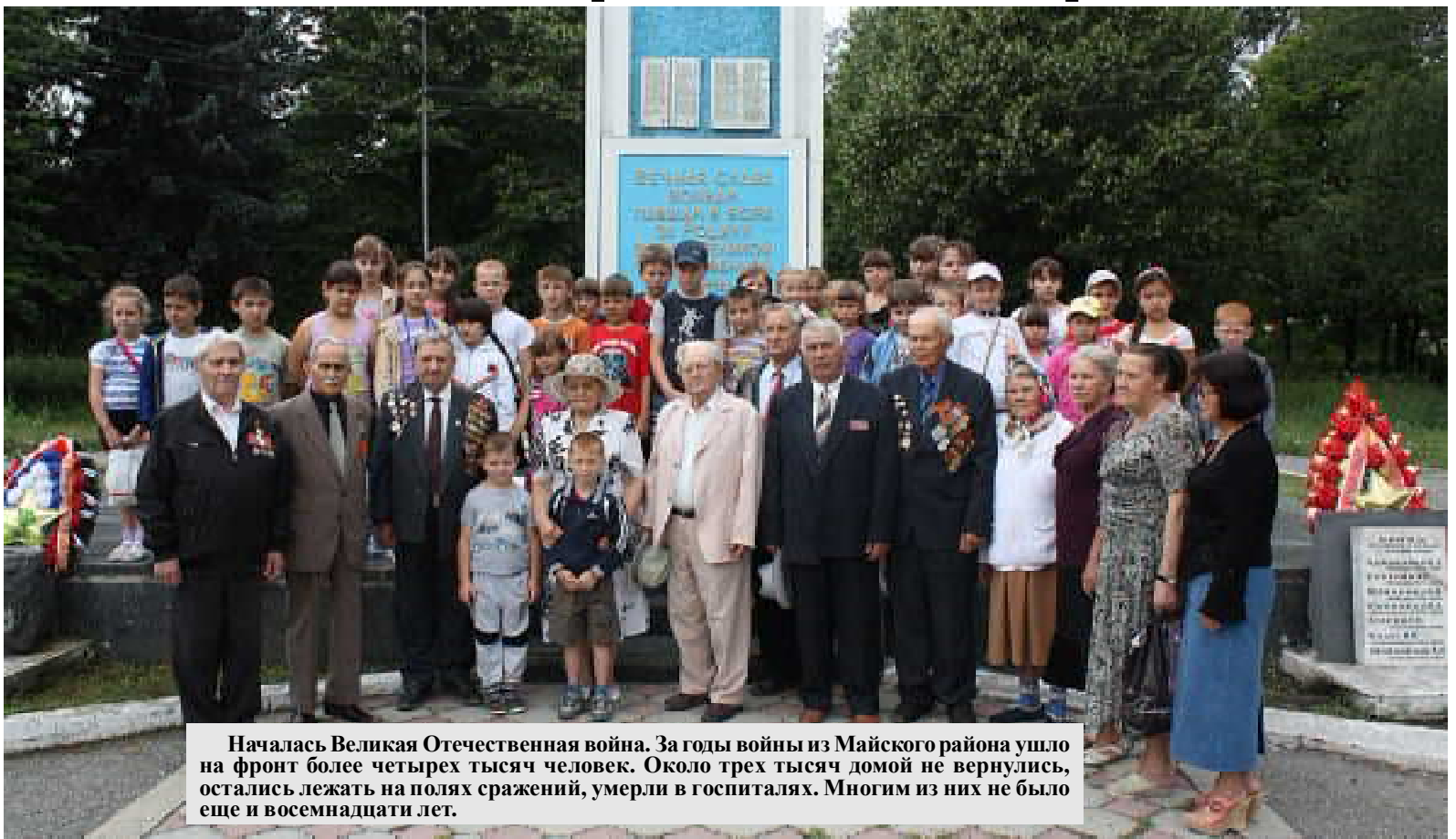
Началась Великая Отечественная война. За годы войны из Майского района ушло на фронт более четырех тысяч человек. Около трех тысяч домой не вернулись, остались лежать на полях сражений, умерли в госпиталях. Многим из них не было еще и восемнадцати лет.