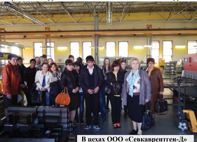
В цехах ООО «Севкаврентген-Д»