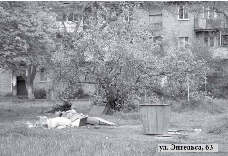
ул. Энгельса, 63