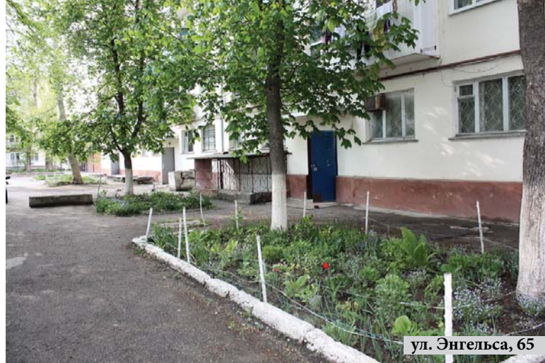
ул. Энгельса, 65

Контейнеры стоят теперь возле каждого дома и предназначены они для сбора мелкого мусора и пищевых отходов. Для