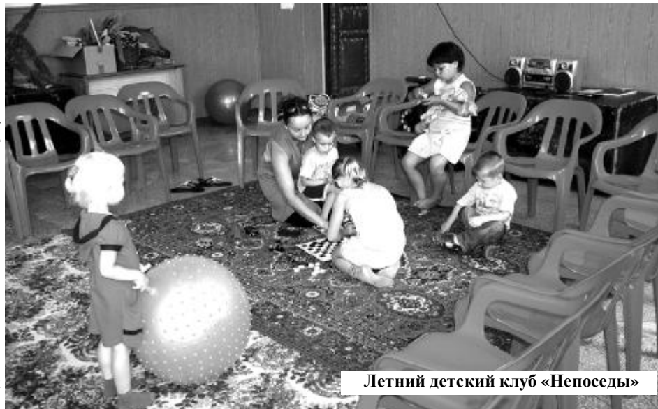
Летний детский клуб «Непоседы»

Проблему отсутствия хорошей аппаратуры решаем за счет проведения платных вечеров отдыха. На собранные средства приобрели усилитель, две колонки, музыкальный центр, стойки для микрофонов, проектор, рекевизит для фитнес-зала, кое-что из мебели.