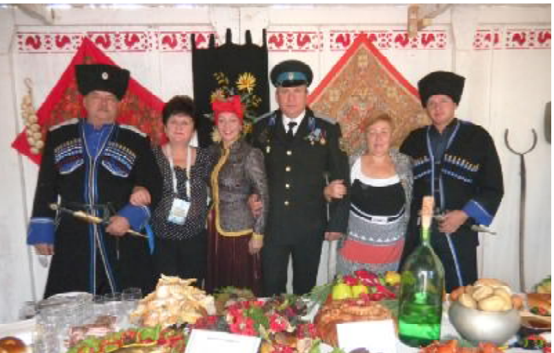
Делегация Майского района

ко демонстрирует физическую подготовку спортсменов, знакомит с творчеством, традициями, культурой наших соседей, но и объединяет народы Кавказа. Помимо успехов в состязаниях, мне хочет-