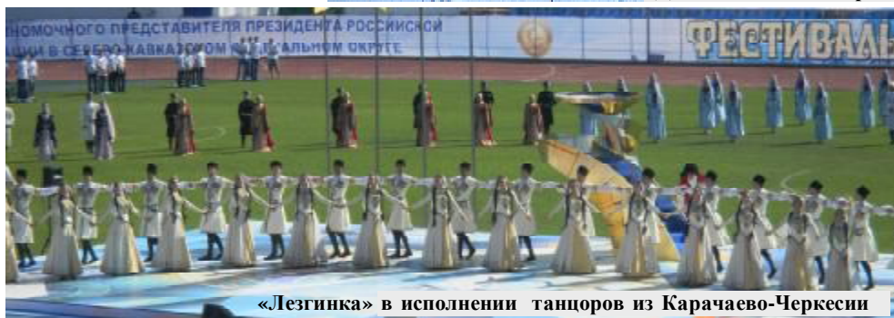
«Лезгинка» в исполнении танцоров из Карачаево-Черкесии