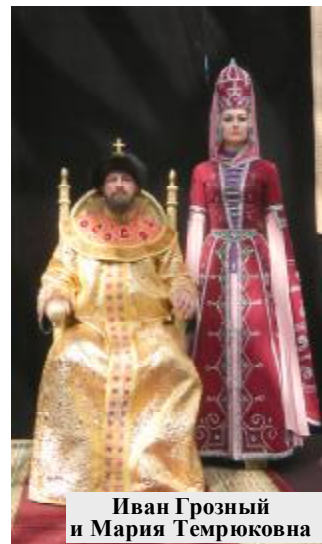
Иван Грозный и Мария Темрюковна

целенаправленно. Пока официальные лица знакомились с национальными подворьями, в спортивном комплексе и на стадионе кипела борьба за первенство.