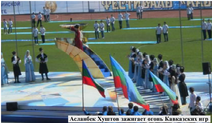
Асланбек Хуштов зажигает огонь Кавказских игр