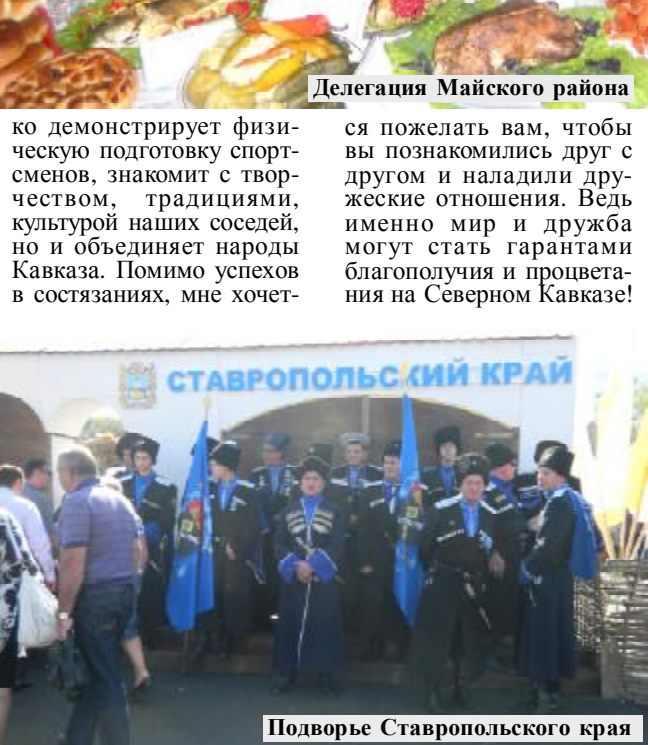
Подворье Ставропольского края