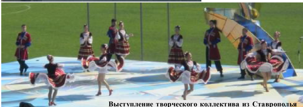
Выступление творческого коллектива из Ставрополя