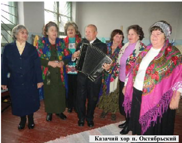
Казачий хор п. Октябрьский